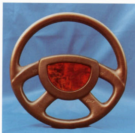
Lenkrad 4-Speichen, Leder schwarz/ Nußwurzholz dunkel Art.-Nr. HV 110464 (passend zur Echtholzausstattung)

Lenkradnabe erforderlich Prallschutz erforderlich