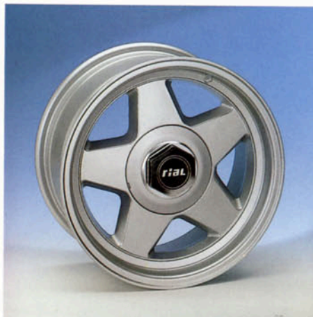
LM-Felge , 7J x 15 H2, abschließbar silber-lackiert Art.-Nr. HV 72980 L