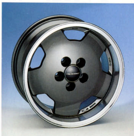
LM-Felge , 8J x 16 CH anthrazit-poliert Art.-Nr. HV 72550 A