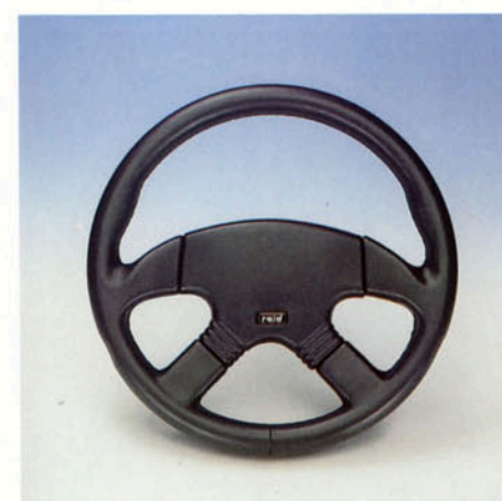
Lenkrad 4-Speichen, Leder schwarz, Prallschutz geschlossen Art.-Nr. HV 110864