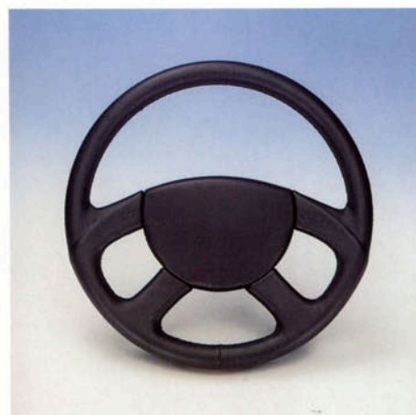
Lenkrad 4-Speichen, Leder schwarz, New Style Art.-Nr. HV 110463