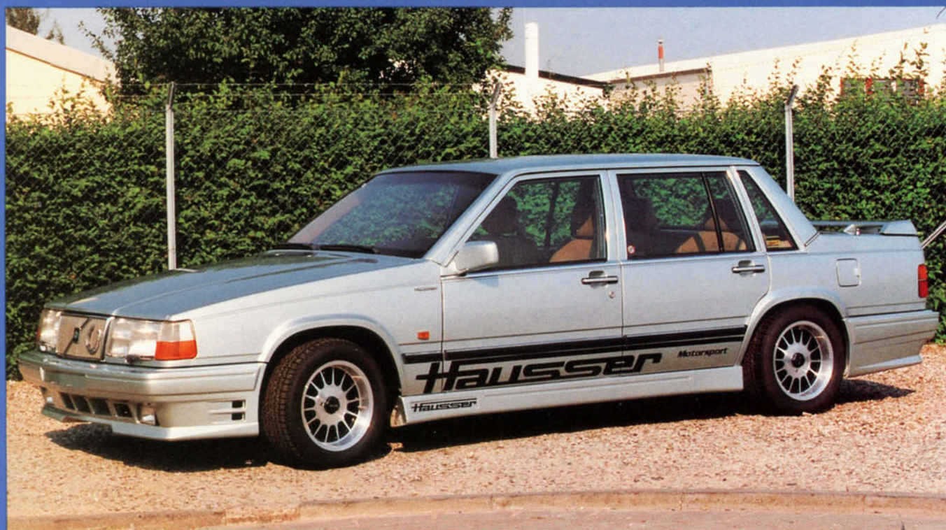
Limousine 764 mit Styling-Kit Art.-Nr. HV 76006 und Hausser-Fahrwerk, Tieferlegung ca. 40 mm, Felge Art.-Nr. HV 72800 W