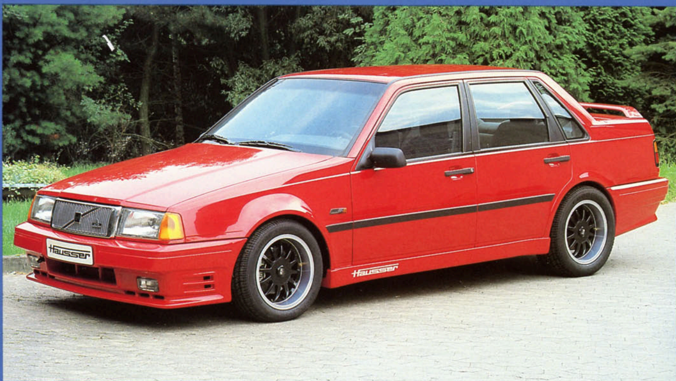
460 mit Styling-Kit Art.-Nr. HV 46006 und Hausser-Fahrwerk, Tieferlegung ca. 35 mm, Felge Art.-Nr. HV 42850 W