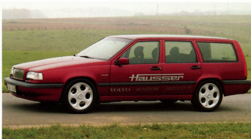
LM-Felge , 7,5J x 17 H2 in silber-poliert, Raddeckel abschließbar, auch lieferbar als