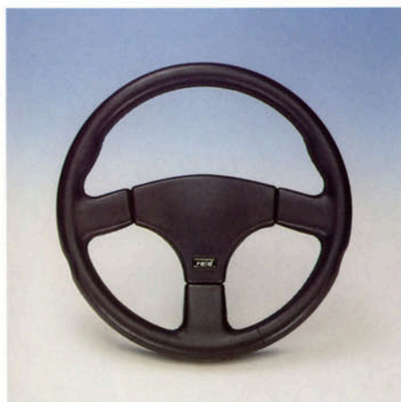
Lenkrad 3-Speichen, Leder schwarz, Standard Art.-Nr. HV 110390

Für VOLVO 340/360/440/460/480/740/760/850/940/960 (Ø 360 mm)