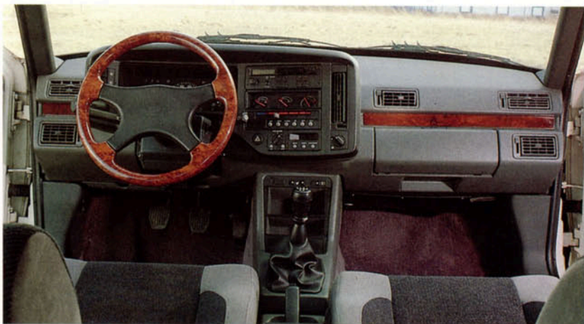
Abb. VOLVO 480 mit Nußwurzelerausstattung