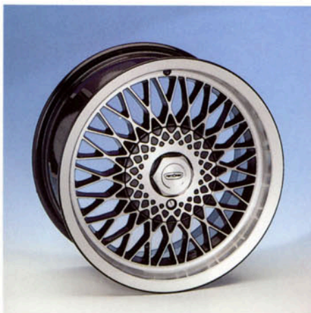
LM-Felge, 7J x 15 H2, abschließbar schwarz-poliert Art.-Nr. HV 42980 W silber-poliert Art.-Nr. HV 42980 S