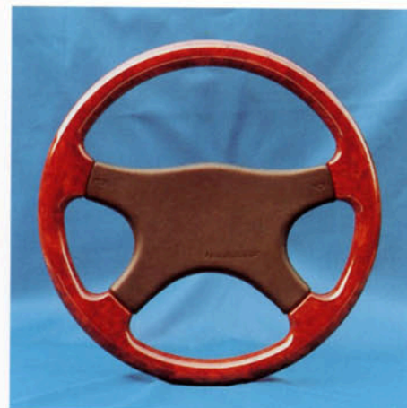
Lenkrad 4-Speichen, Nußwurzholz dunkel Art.-Nr. HV 112364 (passend zur Echtholzausstattung)