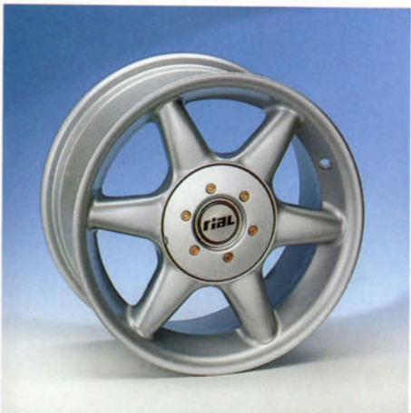
LM-Felge , 7J x 15 H2 silber-lackiert Art.-Nr. HV 72990 L