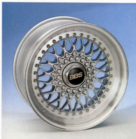
BBS-Rennsportfelge , 7,5 J x 16 H2 3-tlg. geschmiedet silber-poliert Art.-Nr. HV 72300 S