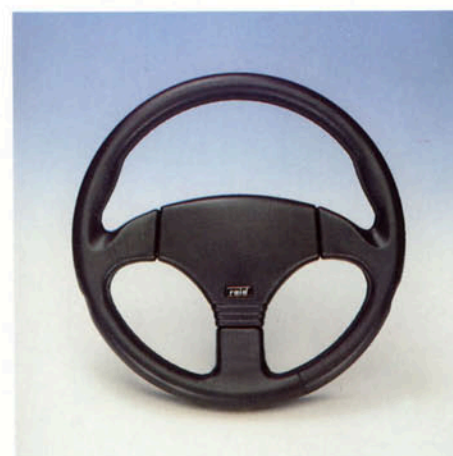
Lenkrad 3-Speichen, Leder schwarz, Prallschutz geschlossen Art.-Nr. HV 110764