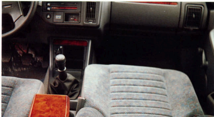
Abb. VOLVO 460 mit Nußwurzelerausstattung

Für VOLVO 440/460 bis Model '93 – bedingt auch ab Modell '94