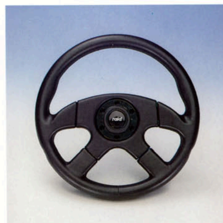
Lenkrad 4-Speichen, Leder schwarz, Prallschutz offen Art.-Nr. HV 110863