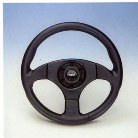
Lenkrad 3-Speichen, Leder schwarz, Prallschutz offen Art.-Nr. HV 110763