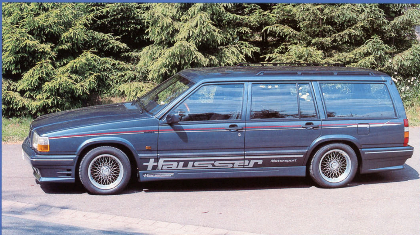
Kombi-Limousine 945 mit Styling-Kit Art.-Nr. HV 94006 und Hausser-Fahrwerk, Tieferlegung ca. 40 mm, Felge Art.-Nr. HV 72100 W