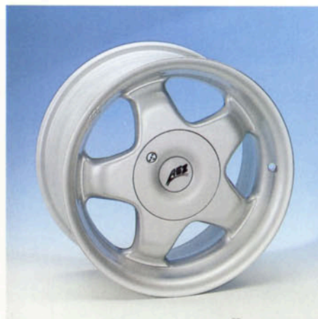
LM-Felge, 7J x 15 H2 Raddeckel abschließbar silber-lackiert Art.-Nr. HV 42350 S