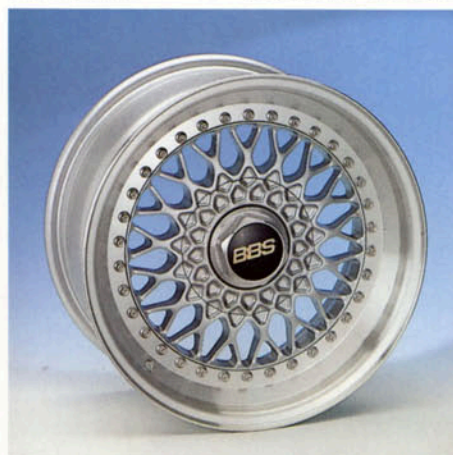
BBS-Rennsportfelge, 7J x 16 H2 3-tlg. geschmiedet silber-poliert Art.-Nr. HV 42300 S