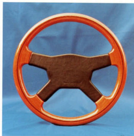
Lenkrad 4-Speichen, Mahagoniholz natur Art.-Nr. HV 112360 (auch in Mahagoni dunkel lieferbar)