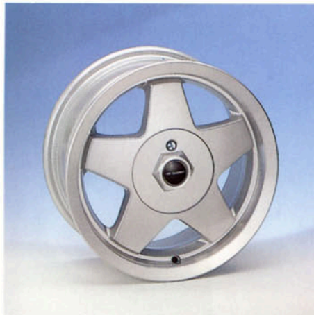
LM-Felge, 6J x 14 H2 Raddeckel abschließbar silber-poliert Art.-Nr. HV 42370 S

Natürlich bekommen Sie auch die passenden (Breit-)Reifen bei uns. Und beachten Sie unsere Komplettad-Angebote. Bei Bestellung bitte den genauen Fahrzeugtyp angeben! Bereifungsinformationen in separater Fulda-Tabelle.