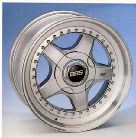
BBS-Rennsportfelge , 8J x 17 H2 3-tlg. geschmiedet silber-poliert Art.-Nr. HV 72350 S