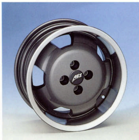
LM-Felge, 7J x 15 H2 silber-poliert Art.-Nr. HV 42650 S anthrazit-poliert Art.-Nr. HV 42650 A