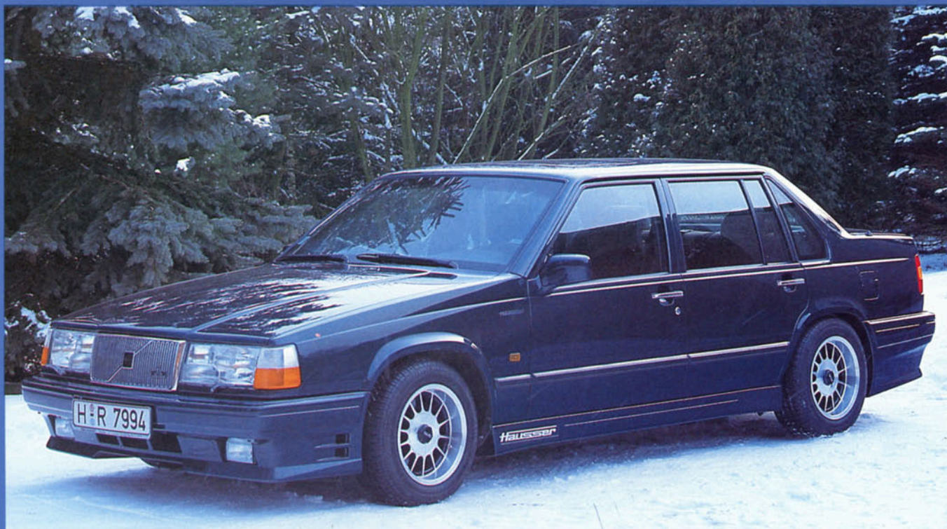
Limousine 964 mit Styling-Kit Art.-Nr. HV 96006 und Hausser-Fahrwerk, Tieferlegung ca. 40 mm, Felge Art.-Nr. HV 72800 W