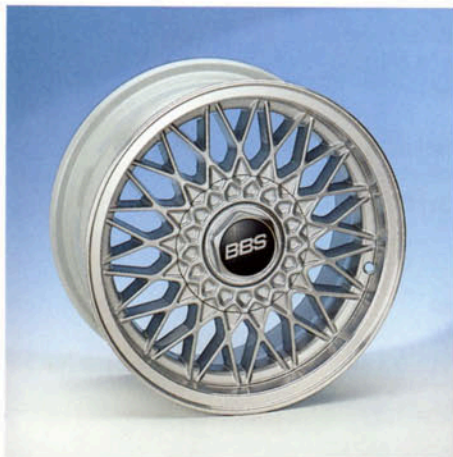
LM-Felge , BBS 7J x 15 H2, abschließbar silber-poliert Art.-Nr. HV 72850 S gold-poliert Art.-Nr. HV 72850 G

Natürlich bekommen Sie auch die passenden (Breit-)Reifen bei uns. Und beachten Sie unsere Kompletttrrad-Angebote. Bei Bestellung bitte den genauen Fahrzeugtyp angeben! Bereifungsinformationen in separater Fulda-Tabelle.