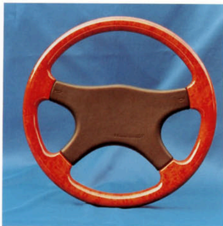
Prallschutz Exklusiv, Leder schwarz Art.-Nr. HV 181100

Für VOLVO 340/360/440/460/480/740/760/940/960 (Ø 360 mm) für VOLVO 240 (Ø 380 mm) ausgenommen HV 110464 und HV 112907