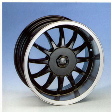
LM-Felge, 7J x 15 H2 schwarz-poliert Art.-Nr. HV 42850 W silber-poliert Art.-Nr. HV 42850 S