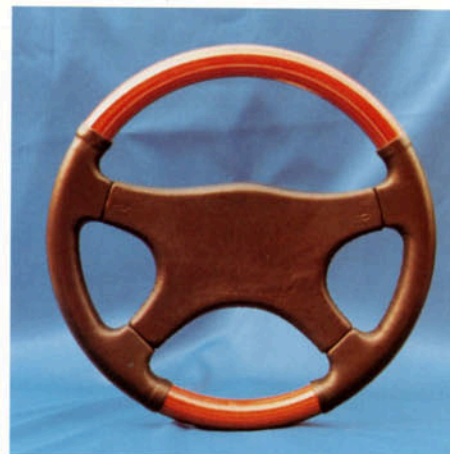
Lenkrad 4-Speichen, Zebrano/Leder, inkl. Prallschutz Exklusiv Art.-Nr. HV 112907 (passend zur Echtholzausstattung)