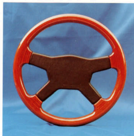
Lenkrad 4-Speichen, Zebrano Art.-Nr. HV 112470 (passend zur Echtholzausstattung)